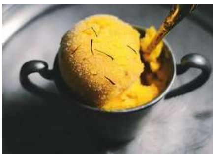
MANGO PASSION KLULFI