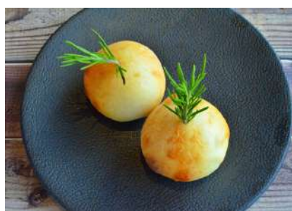
BRIE DE MOU TRUFFE CHEESE NAAN 2P