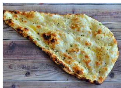
CLASSIC NAAN VEGAN ROTI