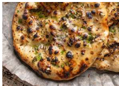
MASALA GARLIC NAAN