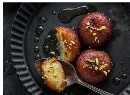
GRAB JAMUN ORANGE3P